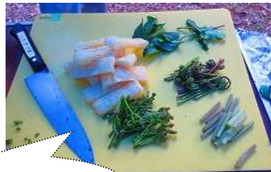
自給自足の食材も愉し